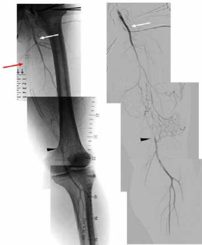
図 1 : 血管造影にて過去に留置したステントおよびステントグラフトが浅大腿動脈起始部より全長閉塞を認めている (赤矢印)。大腿深動脈 (白矢印) からの側副路により浅大腿動脈末梢より血流が再開している (黒矢頭)。