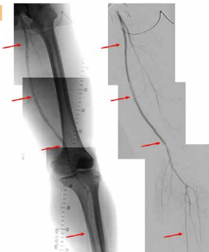
図 2 : 次頁 Intervention 後の血管造影。浅大腿動脈有意の血流となり、ステントおよびステントグラフトは全長で再開通し、下腿 3 分岐以下の血流も良好となった (赤矢印)。